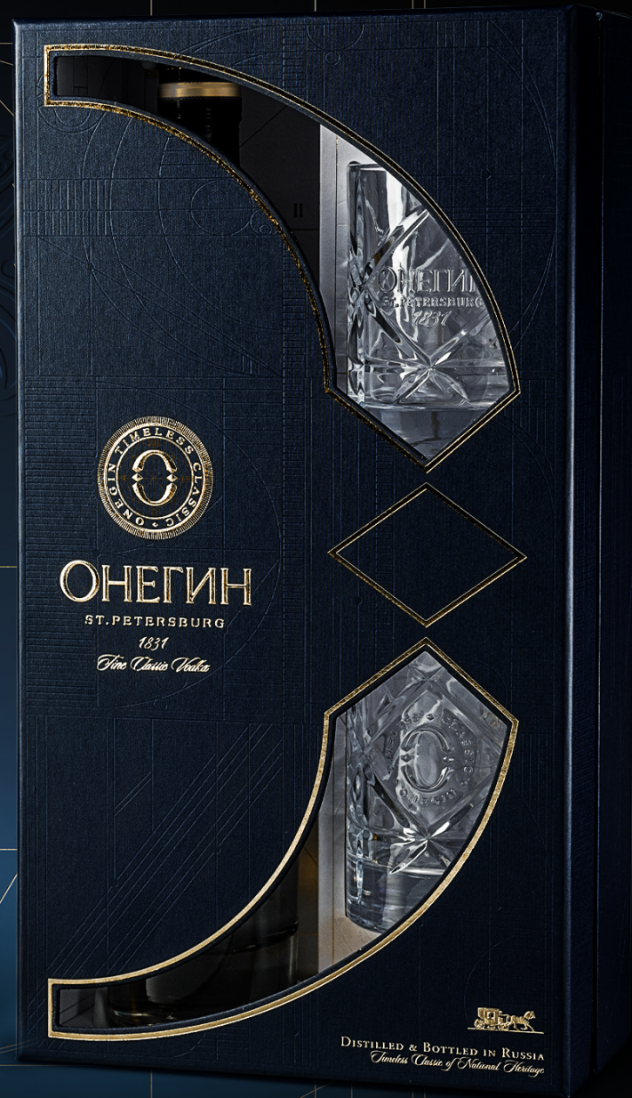
70CL IN GIFT BOX WITH 2 'OLD FASHIONED' TUMBLERS