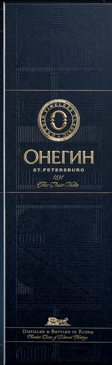
70CL IN GIFT BOX