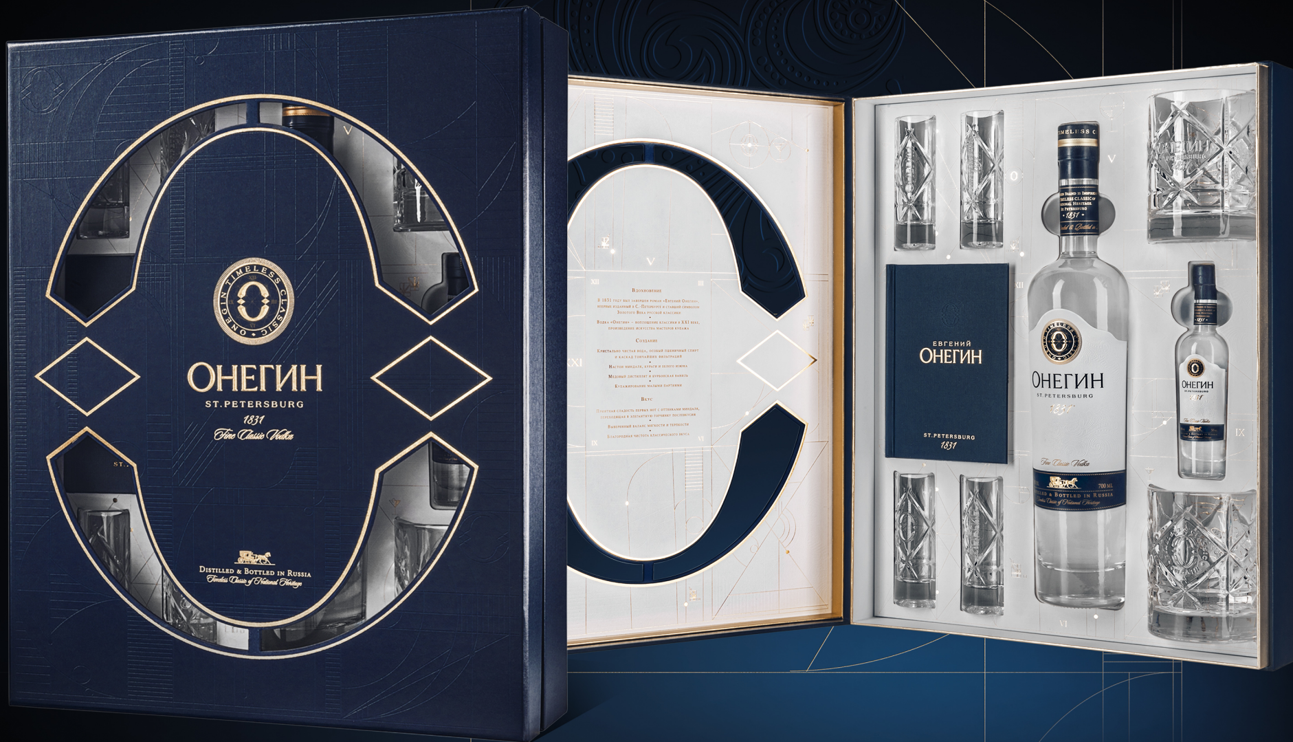
JUMBO GIFT-SET (WITH 9 ITEMS) MMXVI